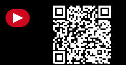
Schuchardt Eröffnungsrede Budapest/Beethoven Jubilar Gedenk-Konzert