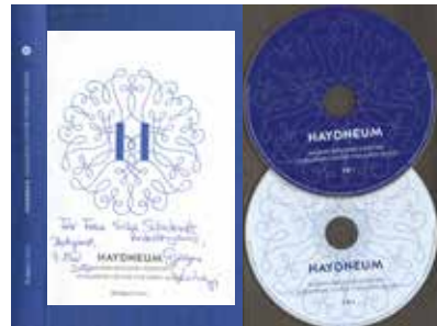
HAYDNEUM HUNGARIAN CENTRE FOR EARLY MUSIC Budapest 2021