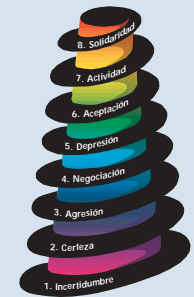
Espirales – símbolos del viaje del alma Asimilación de crisis como vía de aprendizaje en ocho fases espirales