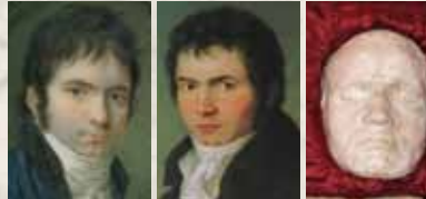
Elfenbein, Hornemann, 1803