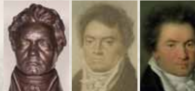
Biaste, Klein, 1812