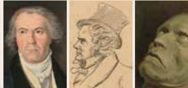
Ölgemälde, Waldmüller, 1823