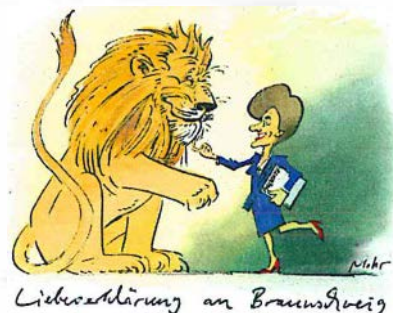
Liebeserklärung an Braunschweig