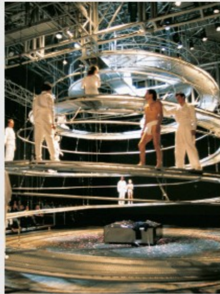
↻ Komplementär-Erlösungs-Spiralweg: Faust II - Inszenierung Peter Stein, Expo H., 2000