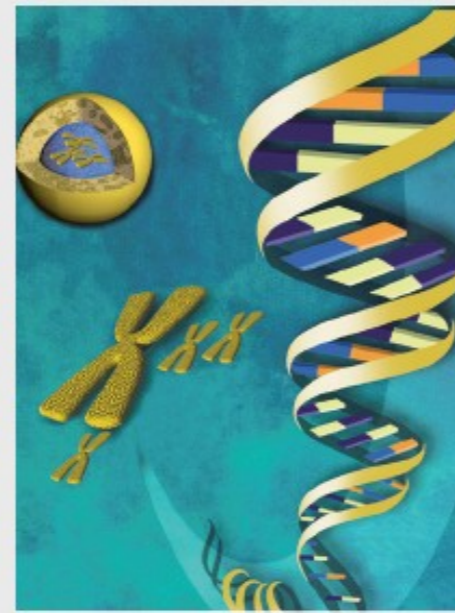
↻ Komplementär-Spirale: Doppel-Helix in der DNA, 20. Jh.