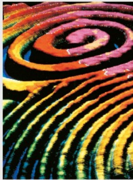
↻ Komplementär-Spiral-Wellen: Oxidation - ,Selbstorganisation', Max Planck Inst., 21. Jh.