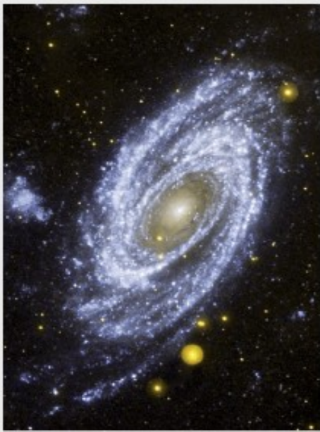
↻ Spiral-Grundform: Galaxie, 10-12 Milliarden Jahre alt