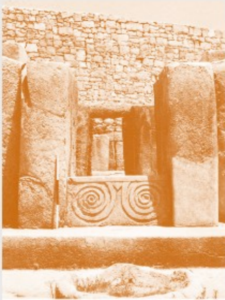
↻ Komplementär-Spiral-Relief, Schwelle Megalith-Tempel, Malta 2400-2300 v. Chr.