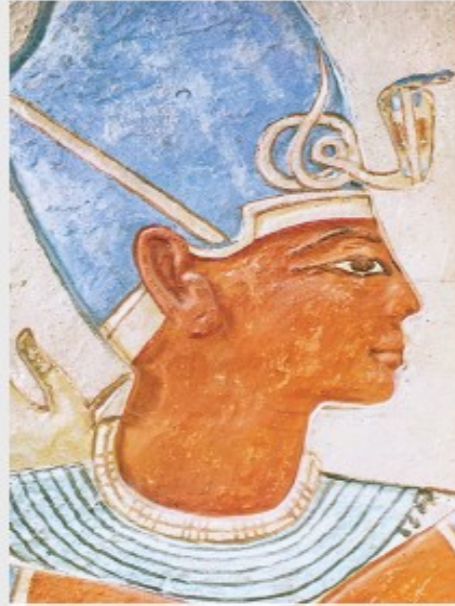
↻ Spiral-Schlange: Uräus, 3. Auge d. Pharaos, Chepresch-Krone, 1290-1069 v. Chr.