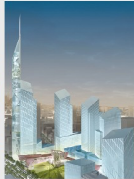
↻ Komplementär-Spiral-Stufen: 1776 feet/Jahre, gepl., Libeskind, NY 2003, erb. Childs 2014