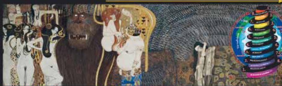
A ROMLÁS kínjai